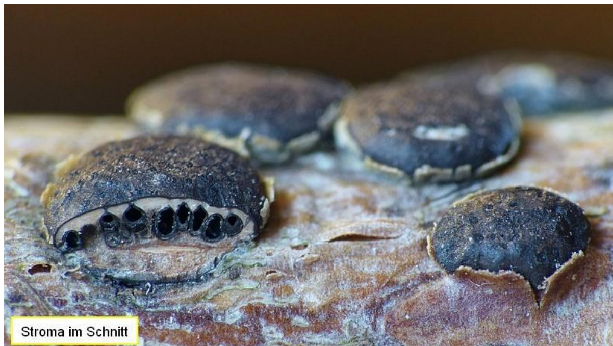
Stroma im Schnitt